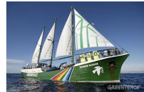
Rainbow Warrior II: Schiff von Greenpeace