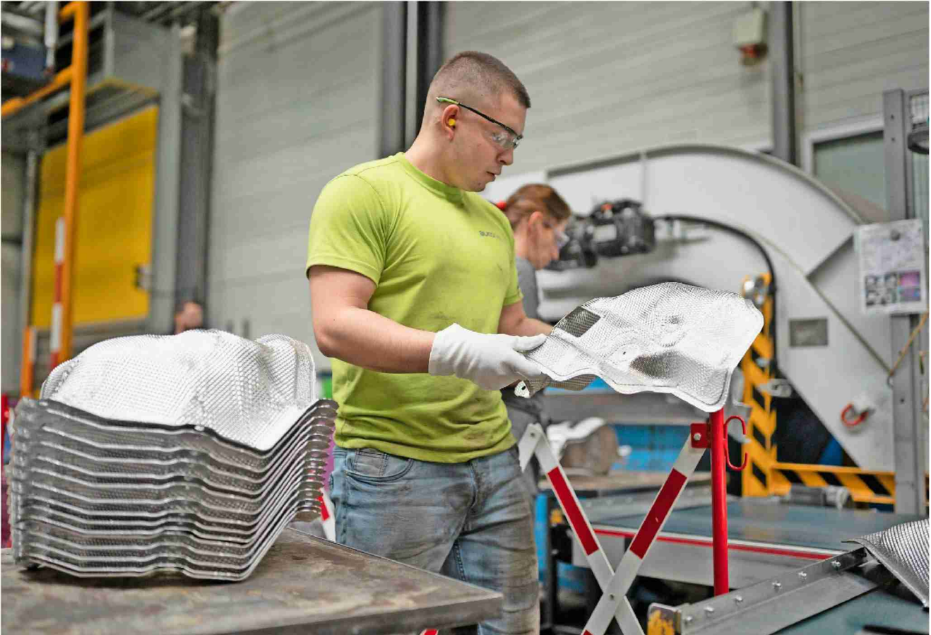
Durch den E-Trend werden auch neue Jobs geschaffen. Doch insgesamt wird es in Zukunft klar weniger Stellen geben.

Autoindustrie Die Verlagerung vom Verbrennungsmotor zum Elektroantrieb setzt Autozulieferer einem starken Anpassungsdruck aus – in der Schweiz stehen bis zu 10 000 Arbeitsplätze auf dem Spiel.